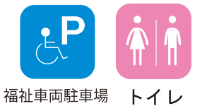
福祉車両駐車場 トイレ