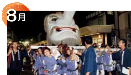
白天狗みこし運行