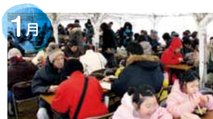
城下町しばた全国雑煮合戦