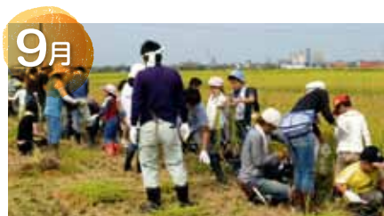
親子ふれあい稲刈り体験