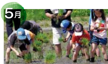
親子ふれあい田植え体験