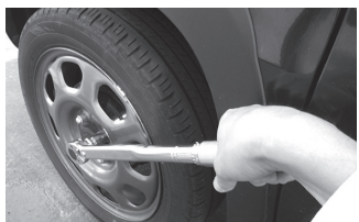
ホイールナットを85Nmで締め付け！安全よし！

【締め付けが弱い時】自動車のタイヤ交換時にホイールナットの締め付けが弱いと走行時の振動によりボルトが緩み、ホイールが外れて重大事故につながります。また工場の生産機械の大電流が流れる電線を接続している端子台では、振動でボルトが緩み、接触不良で発熱、最悪は火災のリスクが高まります。 【締め付けが強い時】ボルトの頭を破損したり、ナットのネジ山(タツプ)が変形し破損したりします。そもそもボルトやナットを使つての締結は、メンテナンス時に分解できることを目的としており、そのために適切にトルク管理する必要があります。ネジの締結は、生産工場の「機械保全」にも必要な技術要素です。