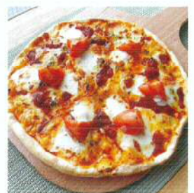
マルゲリータピザ ¥1,500

いと考えております。また、イベント等事前に日時が分かる場合は、対応させて頂いたいただきますのでお気軽にご連絡ください。併せて、春に向けて何かと行事等がありますが、ピザのご予約も随時承らせていただきますので、ご注文の電話をお待ちしております。