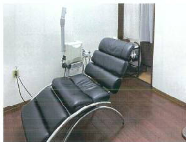
レディースシェービング対応個室

最近ではレディースシェービングを利用するお客様が大変増えてきました。当店は完全個室対応で女性スタッフが対応しています。クレンジングして毛穴の汚れを落とし、顔剃りを行った後、バックで仕上げを施します。月1回の頻度で利用されているお客様も多く