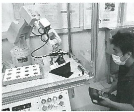
ロボット教示作業風景

当科では夏休み前の集中実習として産業用ロボットの実習として産業界(教示)のティーチング作業(教示)、基本プログラミング、3Dプリンタを用いたハンド機構部品の製作、タッチパネルを連動して生産現場に必要な自動化技術を集約的に学びます。 今後は、在職者向けにロボット分野の研修コースも計画したいとおもいます。