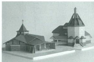
カトリック教会(左)と藤谷虹児記念館のペーパークラフト建築

思っている新発田の町の楽しみ方として、新潟職短の学生が制作した作品巡りをしてみてはいかがでしょうか。例えば、新発田城や白壁兵舎には学生が制作した模型が設置されていますし、新発田祭では金魚台輪がパレードに参加しています。今年の4月から新たに藤谷虹児記念館に学生が制作したペーパークラフト建築の展示を行っています。 また、2月末には当校で今年度の総合制作実習作品の発表・展示会があります。住居環境科では今年度も新発田に関連したテーマに取り組んでいますので、楽しみにしていってください。皆様のご来場を心よりお待ちしております！