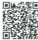
LINE 公式アカウント ご予約・ご相談 受付中