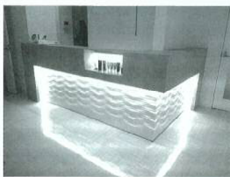
施工の一例 (歯科医院の受付カウンター)