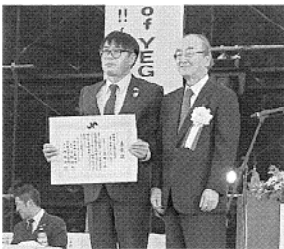
小柴君(左)と日本商工会議所三村会頭