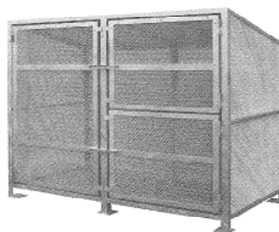
クリーンステーション

い、ではなく関金網に頼め ば何でも出来る！と言わ れるよう臨機応変に対応 し、お客様のニーズにに応 ていきます。来月から新元 号となります。新元号と共 に良き日を歩めるよう成長 し、発展し続けていけるよ う、日々精進してまいりま す。