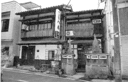
平成30年7月に登録有形文化財建造物に登録された店舗

いうやり方で、肉はA5ランクの米沢牛で肉が苦手な方でも「美味しい」と召し上がって下さり、私達もうれしいです。 よく「敷居が高くて入りにくい」と言われますが、とても気楽で家庭的なお店です。すき焼きだけではなく、家庭料理や季節の一品料理なども提供しております。10年前には、大正ロマン風の椅子席も併設しました。 ほとんど年中無休で営業しておりますので、皆様のご来店をお待ちしております。