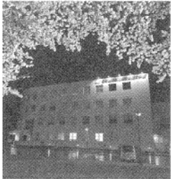
当校と ライトアップされた桜

に、新入生歓迎会、球技大会、新発田まつり、創実祭などの各種イベントを予定しております。これらに加えて、地域のボランティア活動の参加などを通して充実した1年間を過ごして欲しいと願っています。2年後にどのようなように成長しているか非常に楽しみです。 話は変わりますが、当校は学生の教育訓練に加えて、現在企業に勤められている方々のスキルアップの支援として、「能力開発セミナー」を実施しております。 また、企業様と共同で開発を進める「受託・共同研究」、地域の方々への施設開放、地域の方々へのものづくりの楽しさを伝える「公開講座」や「ものづくり体験教室」なども企画・実施します。 当校の情報は、ホームページやフェイスブック、地域の広報誌に掲載していきますので、お見逃しのないようお願いいたします。