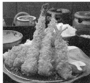
期間限定 「丸ごとアスパラフライと海老ひれ膳」

また5月は「食のアスパラ横丁味めぐり」に当店も参加しており、「丸ごとアスパラフライと海老ひれ膳 (1,480円+税)」を期間限定で提供いたしますので、この機会にぜひご来店いただけますよう、店長・従業員一同お待ちしております。