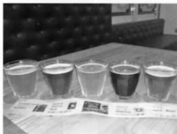
クラフトビール 飲み比べセット 1,000円(税込)

市内では数少なく、注目を浴びている「樽のクラフトビール」をラインアップに加え、高温で一気に焼き上がる地元のアスパラや野菜を使った大き目のピザをメインに、飲料に合う多彩な創作料理を提供しています。