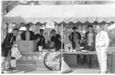
スポーツフェスタでの雑煮販売

いよいよ秋も深まり、肌寒く感じられる今日この頃、皆様いかがお過ごしでしょうか。 さて、私たち新発田商工会議所青年部では、去る9月27日「城下町しばたスポーツフェスタ」、10月11日「いいねっか村上2015」にて雑煮販売を行って参りました。両イベントとも好天に恵まれ秋晴れの下、来場者も多く大変なにぎわいで、用意した「しばた雑煮」も大盛況の内に終わりました。 来場された皆様より「来年も雑煮合戦楽しみにしているよ」「雑煮美