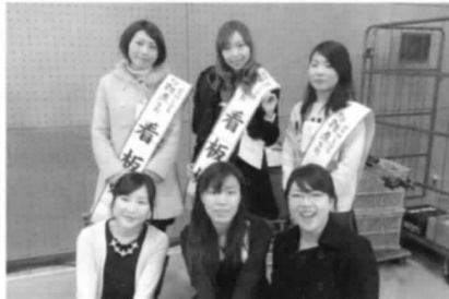
上段：第十一回看板娘、下段：第十回看板娘

晩秋の候、冬の足音が聞こえる時期となってきました。 思い起こせば1年前の11月、日本商工会議所青年部全国会長研修会が新発田で行われました。開催にあたってご協力いただきました皆様、あらためて御礼申し上げます。