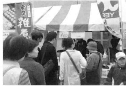
いいねっか村上での雑煮販売

いよいよ秋も深まり、肌寒く感じられる今日この頃、皆様いかがお過ごしでしょうか。 さて、私たち新発田商工会議所青年部では、去る9月27日「城下町しばたスポーツフェスタ」、10月11日「いいねっか村上2015」にて雑煮販売を行って参りました。両イベントとも好天に恵まれ秋晴れの下、来場者も多く大変なにぎわいで、用意した「しばた雑煮」も大盛況の内に終わりました。 来場された皆様より「来年も雑煮合戦楽しみにしているよ」「雑煮美