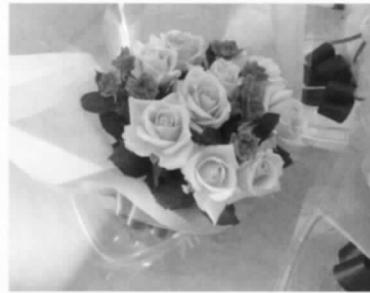
貰うとうれしいバラの花束

⑤五十公野2185 ⑥2612053 http://www.hanaplan.com/