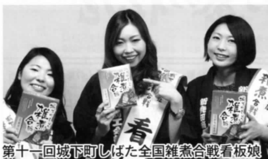
第十一回城下町しばた全国雑煮合戦看板娘