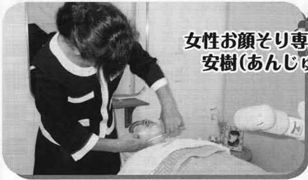
女性お顔そり専門店 安樹(あんじゅ)