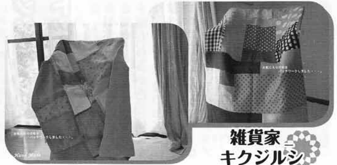
雑貨家 キクジルシ