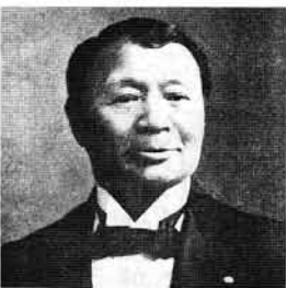
大倉喜八郎 明治44年『致富の鍵』のころ

心事を打ち明けた際、即座に賛意を表し貯えた二十両を与えたという新発田の姉貞子は、十七・八歳のころ幕府の蝦夷地御用取扱で拓提島の開発に尽力した近藤重蔵の著書『返要分界図考』十五巻を写本して愛蔵したほどの人だった。海外に目を向ける素地は充分あったと思われる。後、翁は海外での事業について「内地に於いてまだ遺利もあるう事業もあるう、その他利益ある仕事もあるに相違ないが、これらの事は随分内地に於いてやる人があるのであつて、なにも我々はそう恋々たるの必要はない：」(『致富の鍵』明治四十四年刊)と語っている。