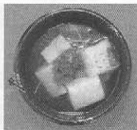
「御柱の恵み雑煮」 下諏訪 YEG (長野県)

煮合戦上位入賞の常連、長野県の「下諏訪商工会議所青年部」御柱恵み雑煮。下諏訪町地産の水と地元特産の凍み豆腐等を使った、新発田でのファンも非常に多い雑煮が入賞しております。出来れば舌鼓を打ちながら、入賞雑煮をお腹一杯食べてみたいものです。こうして振り返りますと、審査方法やステージイベント等、従来とは少しばかり手法を変更した事もあり、当日朝まで心配の種は消えませんでした。やは