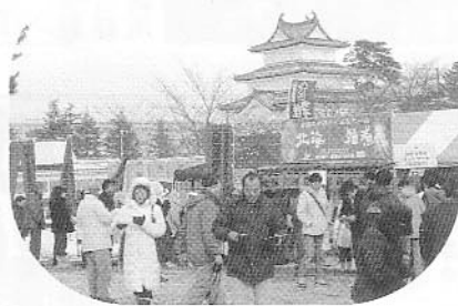
賑わいを見せる会場

去る1月13日(日)に、新発田商工会議所青年部主催で「第四回城下町しばた全国雑煮合戦」が新発田城址公園にて行われました。