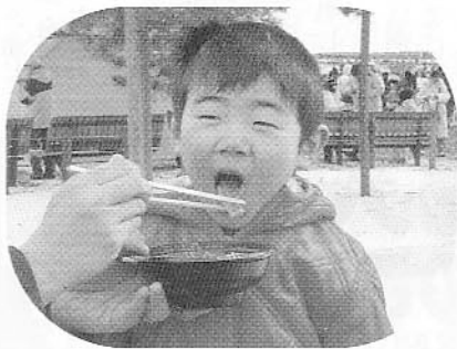
あたたかい雑煮「おいしい！」