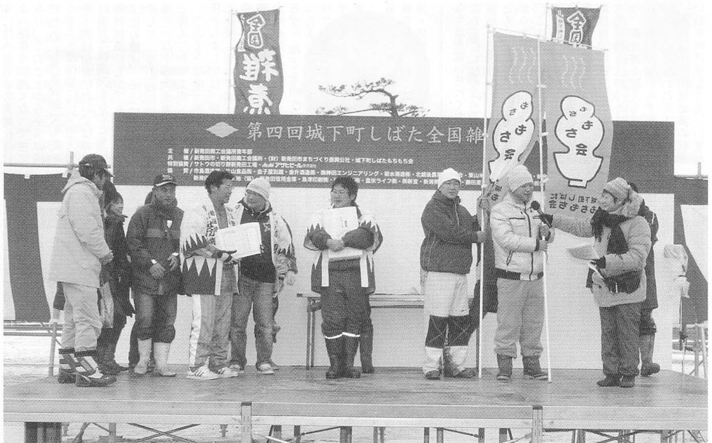
第四代征夷大將軍(優勝)のインタビューを受ける城下町しばたもちもち会の高澤会長